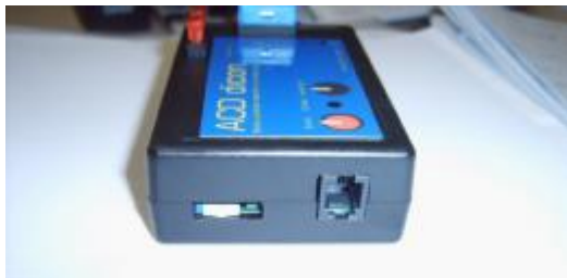
Polaritätsschalter und Kabelanschluss

Rot + Leitung (Power) entspricht weiß in den USA Schwarz - Leitung (Break) entspricht rot in den USA Gelb Motor (Wiper) entspricht schwarz in den USA